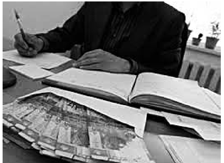
былтырғы жылдың аяғындағы (шамамен 100 доллар) деп ресми есеп бойынша 18 мың 774 теңге бекітілген.

Статистика агенттігі дерегінше, 2014 жылы Қазақстанда орташа жалақы мөлшері 154 мың 577 теңге немесе 835 АҚШ доллары болған. Елдегі ең аз жалақы мөлшері – 21 мың 364 теңге (115 доллар). Ал ең төменгі күнкөріс деңгейі,